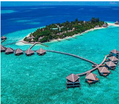
Villaggio turistico (is. Maldive)