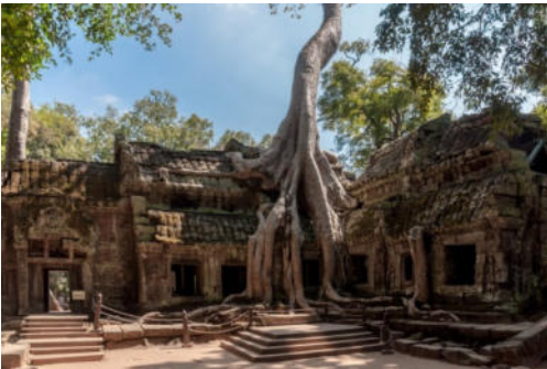
Tempio Ta Prohm (Cambogia)

Un tempio maestoso e misterioso, immerso nella natura selvaggia, situato nel cuore della Cambogia. Il tempio Ta Prohm si trova nel cuore della giungla in Cambogia. Qui la natura selvaggia a poco a poco sta invadendo tutto il sito con i ficus strangolatori si sono impossessati delle rovine, inglobando i muri nel loro tronco. Ta Prohm fa parte dei luoghi di culto di Angkor ed è senza dubbio il più famoso tempio. Piante rampicanti, tronchi e radici secolari rappresentano ormai parte del fascino del tempio che ogni anno attira migliaia di turisti ed è uno dei siti archeologici più noti della zona. Qui un tempo sorgevano centinaia di edifici sacri buddisti e induisti, oggi per la maggior parte distrutti e inghiottiti dalla giungla. Dopo la caduta dell'impero Khmer, la struttura venne abbandonata per secoli e solo nel 1900 si iniziò un'opera di restauro.