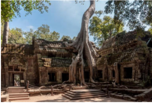
Tempio Ta Prohm (Cambogia)

Un tempio maestoso e misterioso, immerso nella natura selvaggia, situato nel cuore della Cambogia. Il tempio Ta Prohm si trova nel cuore della giungla in Cambogia. Qui la natura selvaggia a poco a poco sta invadendo tutto il sito con i ficus strangolatori si sono impossessati delle rovine, inglobando i muri nel loro tronco. Ta Prohm fa parte dei luoghi di culto di Angkor ed è senza dubbio il più famoso tempio. Piante rampicanti, tronchi e radici secolari rappresentano ormai parte del fascino del tempio che ogni anno attira migliaia di turisti ed è uno dei siti archeologici più noti della zona. Qui un tempo sorgevano centinaia di edifici sacri buddisti e induisti, oggi per la maggior parte distrutti e inghiottiti dalla giungla. Dopo la caduta dell'impero Khmer, la struttura venne abbandonata per secoli e solo nel 1900 si iniziò un'opera di restauro.