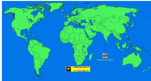
Dove sono le Maldive?

10- Evidenzia gli elementi della foto che secondo te sono particolarmente significativi nell'evidenziare (aiutati anche con la carta):