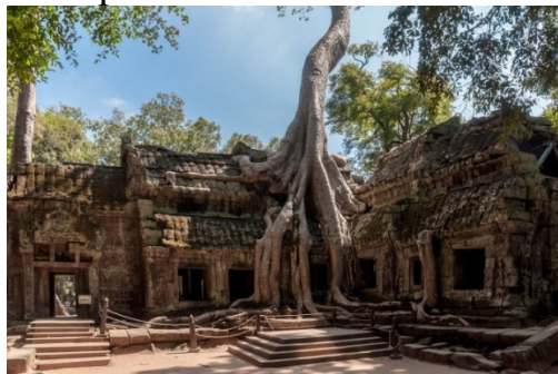
Tempio Ta Prohm (Cambogia)

Un tempio maestoso e misterioso, immerso nella natura selvaggia, situato nel cuore della Cambogia. Il tempio Ta Prohm si trova nel cuore della giungla in Cambogia. Qui la natura selvaggia a poco a poco sta invadendo tutto il sito con i ficus strangolatori si sono impossessati delle rovine, inglobando i muri nel loro tronco. Ta Prohm fa parte dei luoghi di culto di Angkor ed è senza dubbio il più famoso tempio. Piante rampicanti, tronchi e radici secolari rappresentano ormai parte del fascino del tempio che ogni anno attira migliaia di turisti ed è uno dei siti archeologici più noti della zona. Qui un tempo sorgevano centinaia di edifici sacri buddisti e induisti, oggi per la maggior parte distrutti e inghiottiti dalla giungla. Dopo la caduta dell'impero Khmer, la struttura venne abbandonata per secoli e solo nel 1900 si iniziò un'opera di restauro.