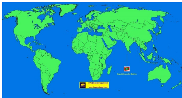
Dove sono le Maldive?